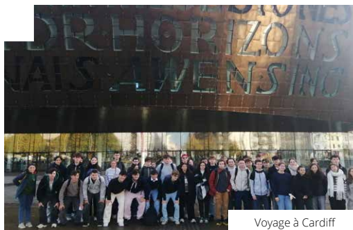
Voyage à Cardiff