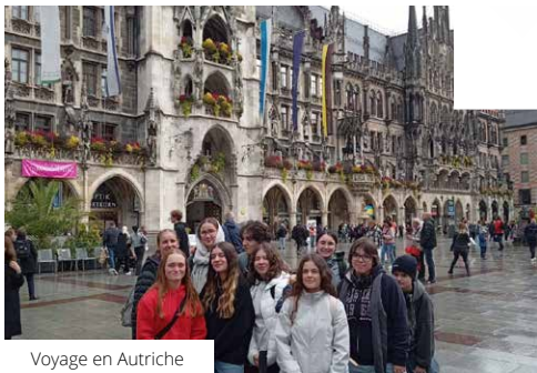
Voyage en Autriche