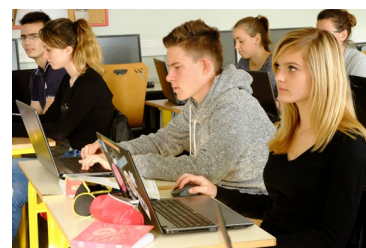
Un ordinateur portable est mis à disposition de chaque élève.